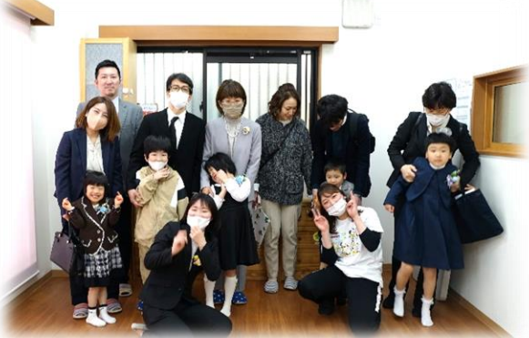
〔 り ん ご 組 〕