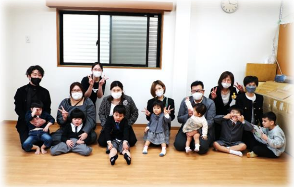
〔 ば な な 組 〕