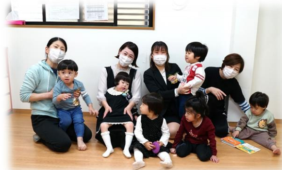
〔 も も 組 〕